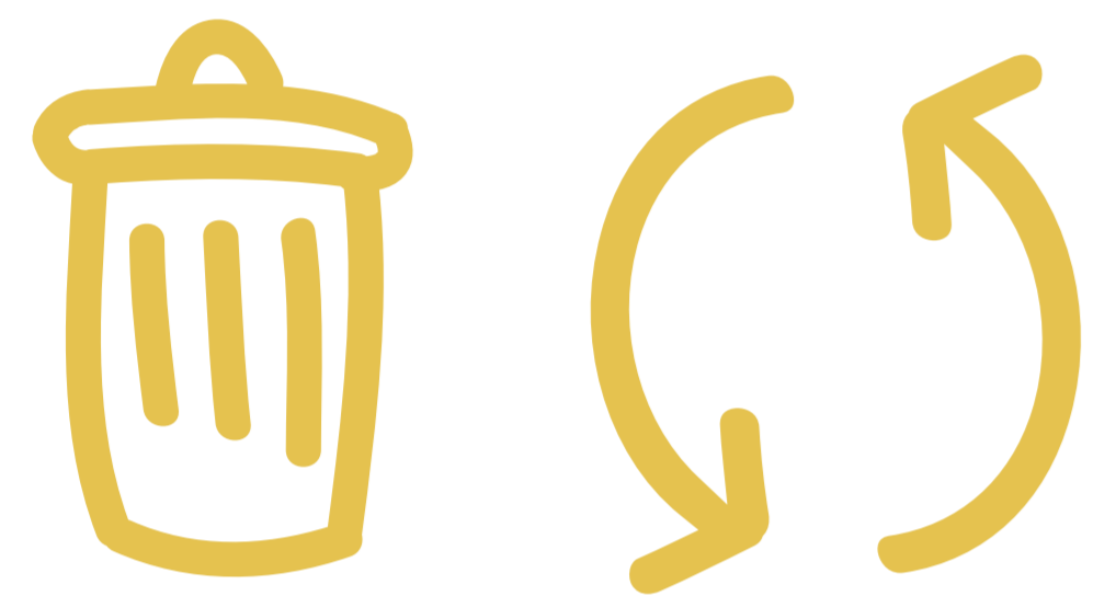
PRÉVENTION & GESTION DES DÉCHETS