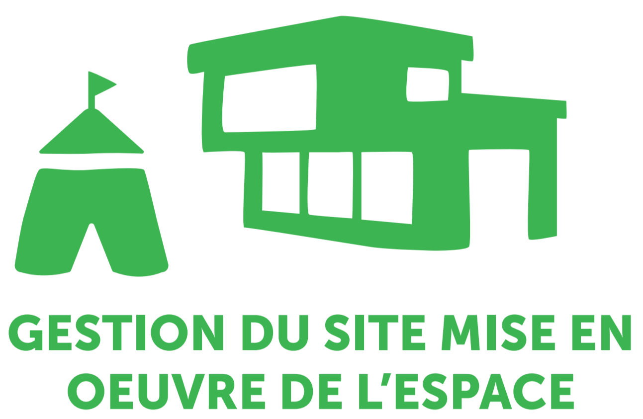
GESTION DU SITE MISE EN OEUVRE DE L'ESPACE