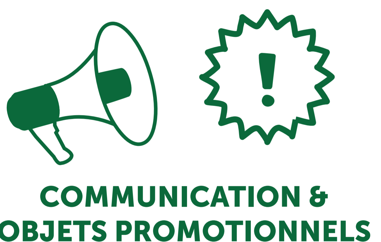
COMMUNICATION & OBJETS PROMOTIONNELS